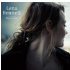
CD des Monats > Mehr Infos