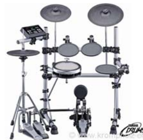
E-Drum Yamaha DTX-550K > Mehr Infos